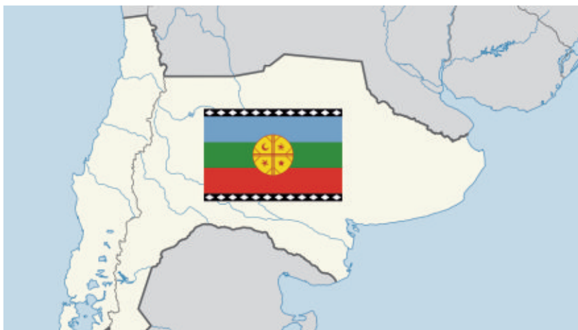
Figura 2. Territorio ancestral mapuche..

Según Rodríguez (2022a; como se citó en Martínez et al., 2021), la relevancia del empresario forestal en el conflicto es de gran importancia, ya que estos son los propietarios de las tierras y que compraron al Estado chileno y que pertenecía a los mapuches. Esas tierras fueron reivindicadas por el pueblo mapuche durante el siglo XX mediante el uso de vías institucionales y la acción directa de comunidades indígenas. Lo que desencadenó en la década de los 90 un conflicto entre las diferentes comunidades por el extractivismo, siendo potenciado por el estado neoliberal en Chile. De igual forma, se deben tener en cuenta otros elementos que están presentes en estas organizaciones armadas y es el enjuiciamiento de diferentes miembros de estas, los cuales, han sido